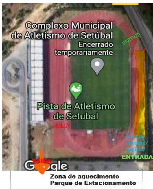
Figura 4: Entrada e saída da Pista de Atletismo. Zona de aquecimento no parque de estacionamento.