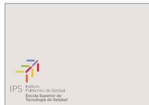
(ii) cor de fundo que não interfira com nenhuma das que compõem o logo