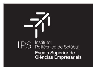
Logótipo em negativo

| Fundo colorido (com ou sem fotografia): apresentam-se duas soluções – (i) uso de filtro de contraste para destacar o logo sobre a imagem ou (ii) optar por uma cor de fundo que não interfira com nenhuma das que compõem o logo.