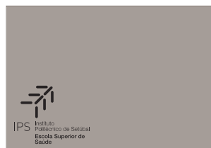
Logótipo a preto sobre fundo de cor