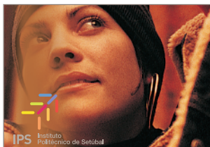
(i) uso de filtro de contraste para destacar o logo sobre a imagem