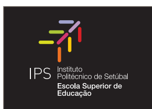
Logótipo a cores em fundo preto