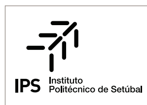
Versão Institucional | a uma cor